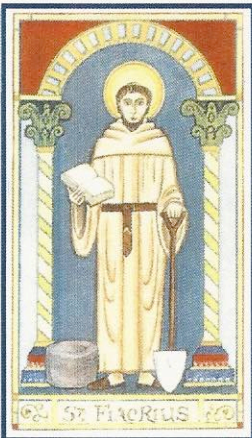
Schutzpatron der Koloproktologen